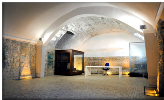
Sala conferenze "La porta del Parco"

Il racconto di Circe « con gli occhi dei Greci »