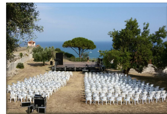
Area archeologica della "Villa dei Quattro Venti"

Giove Anxur e Feronia: una coppia divina a Terracina e nell'Italia centrale antica